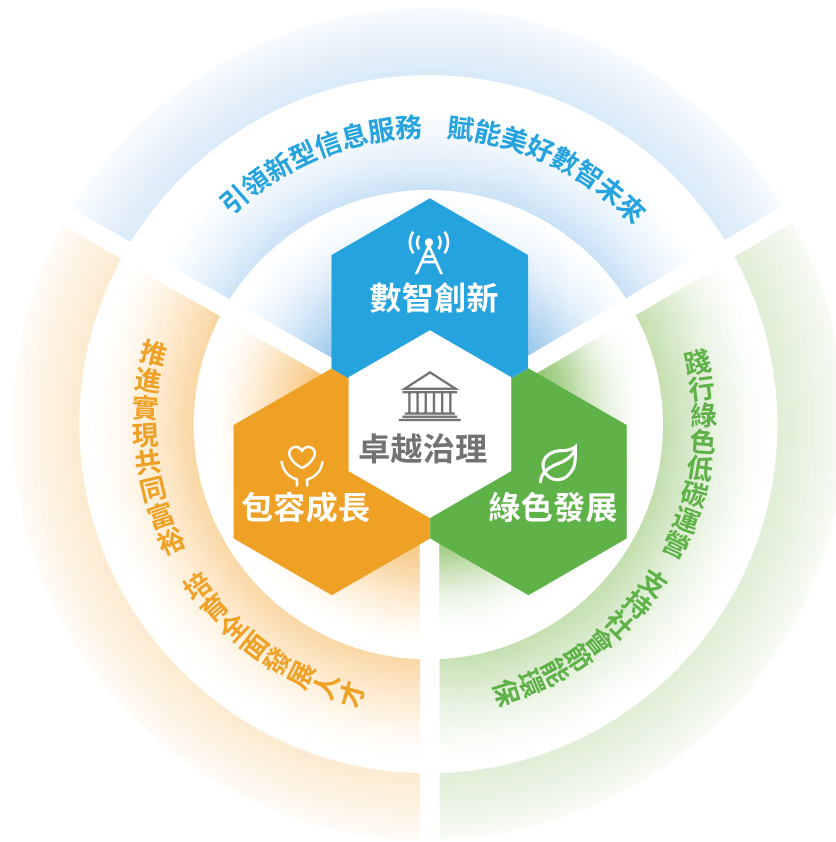
中國移動可持續發展模型