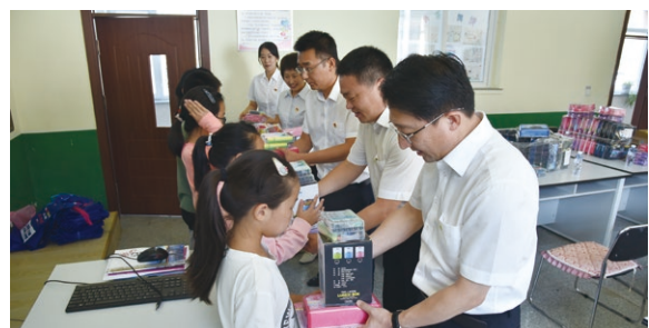
○ 遼寧公司開展“學雷鋒”留守兒童幫扶活動