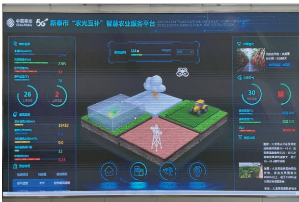
山東新泰 5G+ 光伏智慧農業平台