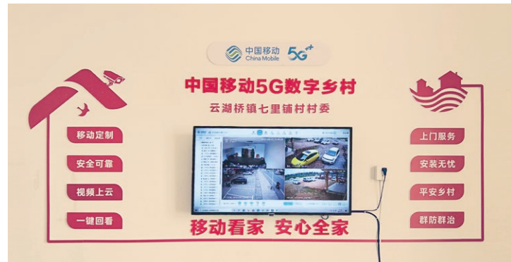
○ 湖南七里鋪村中國移動 5G 數字鄉村服務平台

在湖南，我們在七里鋪村建設全省首個“平安鄉村 2.0”示範村，基於移動看家雲平台，增設周界 AI 識別攝像頭、智能喇叭攝像頭以及智能煙感等多類型安防終端，配合 5G 數字鄉村管控平台及大屏展示設備，實現全天候不間斷錄像、煙感檢測、AI 警戒識別等功能，為村民營造安心、放心的環境。