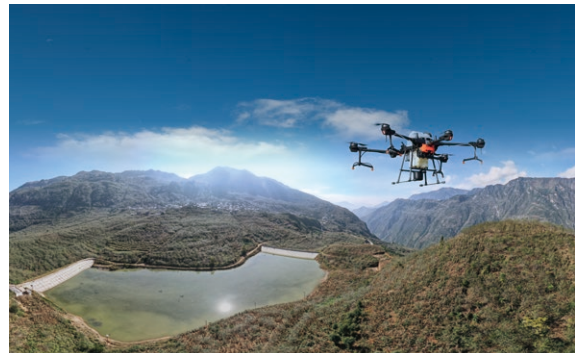
○ 5G 無人機在四川省涼山州金陽縣執行植物保護任務

截至 2021 年底，5G+智慧農業的發展帶動 520 戶重點幫扶對象、2,280 人直接增收 400 餘萬元，為金陽縣鞏固拓展脫貧攻堅成果，推動實現鄉村振興提供了強大的產業支撐。