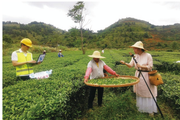
福建秋茶豐收季 5G 茶園直播間