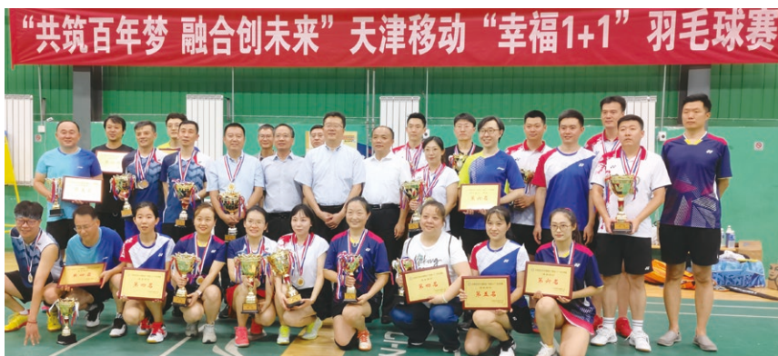
○ 天津公司羽毛球賽