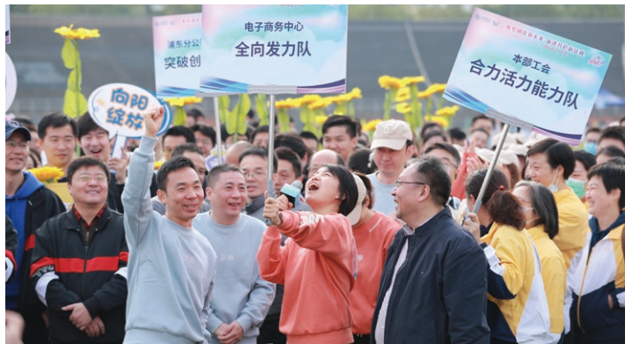
○ 上海公司趣味運動會