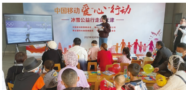
在天津泰達國際心血管醫院開展愛“心”行動冰雪公益活動

愛“心”行動旨在為困境先心病兒童提供免費篩查與救治。2021年，公司對3,291名困境兒童進行篩查，手術救治患兒495名。在開展延續項目的基礎上，我們還在陝西選取當地醫療機構，探索“屬地醫保+慈善捐贈+合作醫院減免”的新模式，惠及更多先心病患兒。自2011年開展以來，項目已經為全國61,898名貧困兒童進行篩查，並對確診的7,069名貧困先心病患兒提供了全額免費手術救治，累計捐款超過2億元。