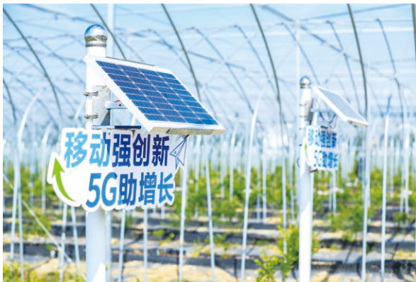
在南京國家農業高新技術產業示範區打造數字農場平台