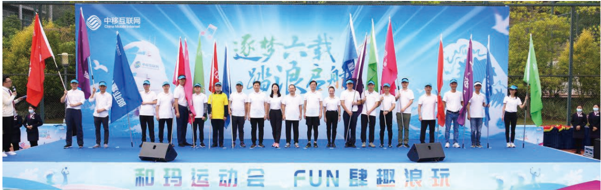
○ 互聯網公司員工趣味運動會