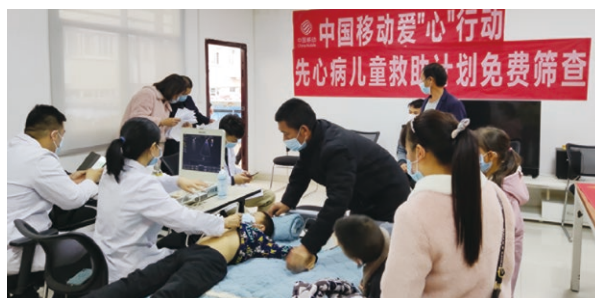
在貴州開展愛“心”行動先心病兒童免費篩查