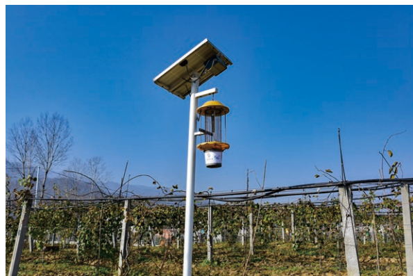
陝西智慧農村物聯網殺蟲燈