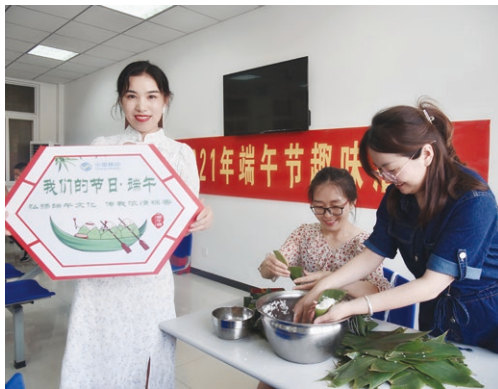
○ 安徽公司端午節系列活動