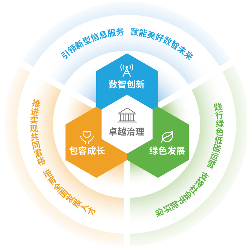
中国移动可持续发展模型