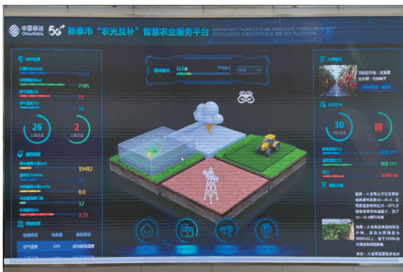
山东新泰 5G+光伏智慧农业平台