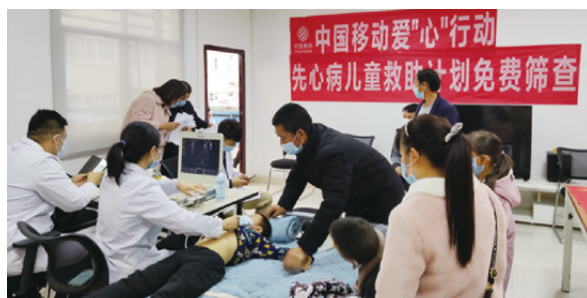
在贵州开展爱“心”行动先心病儿童免费筛查