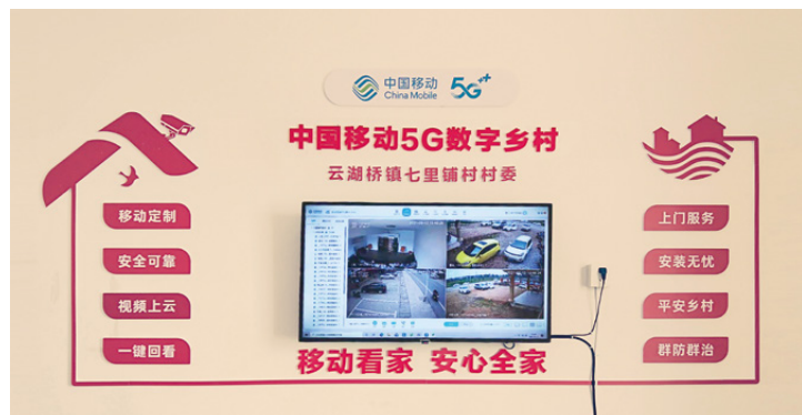
湖南七里铺村中国移动 5G 数字乡村服务平台

在湖南，我们在七里铺村建设全省首个“平安乡村 2.0”示范村，基于移动看家云平台，增设周界 AI 识别摄像头、智能喇叭摄像头以及智能烟感等多类型安防终端，配合 5G 数字乡村管控平台及大屏展示设备，实现全天候不间断录像、烟感检测、AI 警戒识别等功能，为村民营造安心、放心的环境。