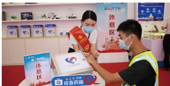
广西公司志愿者为户外工作者提供应急药箱服务

积极参加扶贫助学、募集冬衣、文明创城交通协管、社区服务等志愿活动，累计捐助“腾讯公益”项目 96 个，捐款 120 次，捐款总额达 4.6 万余元。