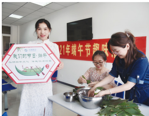
○ 安徽公司端午节系列活动