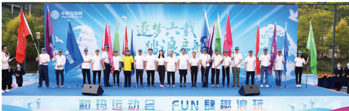
○ 互联网公司员工趣味运动会