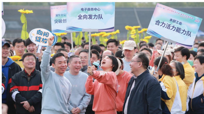
○ 上海公司趣味运动会