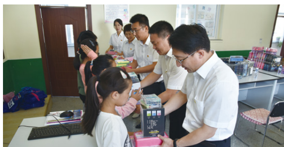
辽宁公司开展“学雷锋”留守儿童帮扶活动