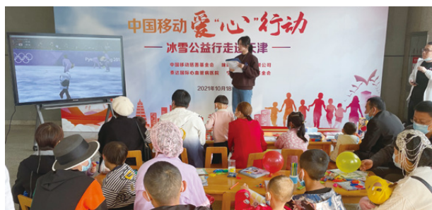
在天津泰达国际心血管医院开展爱“心”行动冰雪公益活动

爱“心”行动旨在为困境先心病儿童提供免费筛查与救治。2021年，公司对3,291名困境儿童进行筛查，手术救治患儿495名。在开展延续项目的基础上，我们还在陕西选取当地医疗机构，探索“属地医保+慈善捐赠+合作医院减免”的新模式，惠及更多先心病患儿。自2011年开展以来，项目已经为10个省（区）的61,898名贫困儿童进行筛查，并对确诊的7,069名贫困先心病患儿提供了全额免费手术救治，累计捐款超过2亿元。